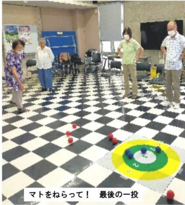
マトをねらって! 最後の一投