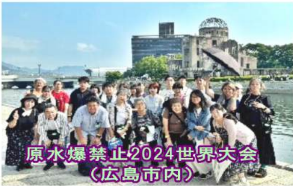
原水爆禁止2024世界大会 (広島市内)

原水爆禁止2024世界大会(8/3~8/9)に医療福祉生協おおさかから、労組代表団と併せて30人が参加しました。