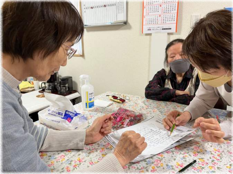
この後のオシャベリタイムもお楽しみ (きなんせ)