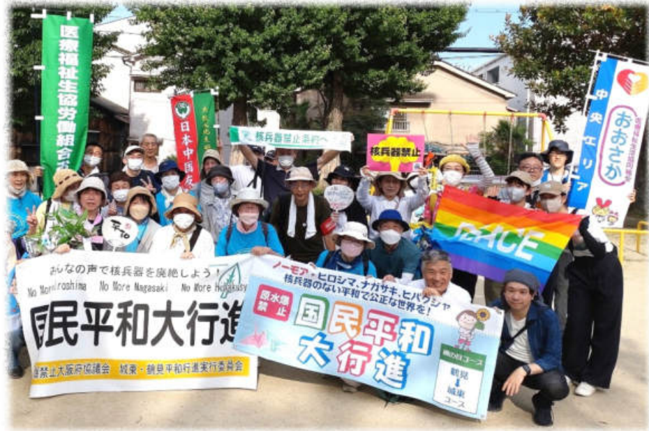
国民平和行進網の目コースゴール地点(旭区 大宮南公園)

城東診療所 (06) 6931-0779 〒536-0004 城東区今福西1-1-30 なかはまヘルパーステーション (06) 6167-3133 〒536-0021 城東区諏訪4-7-24 101号 蒲生厚生診療所 (06) 6931-3807 せいきょう三丁目歯科 (06) 6936-8241 蒲生デイケア(通所リハビリテーション) (06) 6931-5050 なでしこヘルパーステーション (06) 6932-0590 コープケアプランセンター城東 (06) 6932-0593 〒536-0016 城東区蒲生3-15-12 メディカルコープビル コープおおさか病院 (0570) 06-1100 〒538-0053 鶴見区鶴見3-6-22