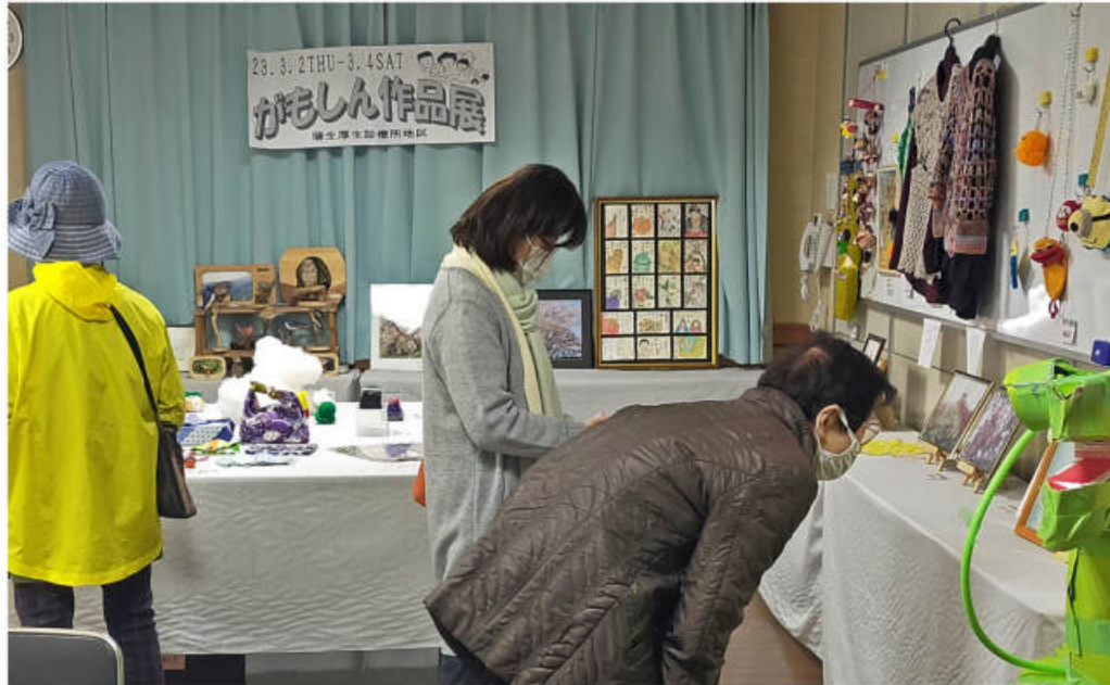
寄せられた作品に魅せられて (3月2日 蒲生厚生診療所 組合員ルーム)