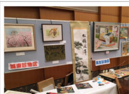
鶴見区民センター(3月23日)にて

ヘルスコープおおさか23周年記念式典が鶴見区民センターで3月23日に開催されました。そこで